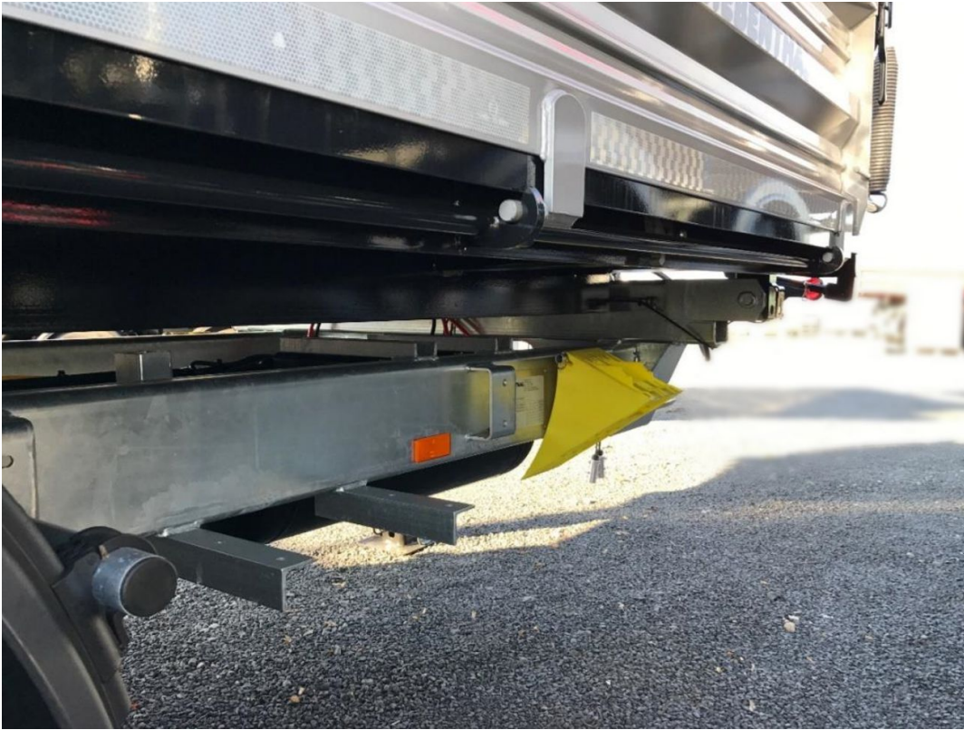
Hier sind der Rahmen und der Kippaufbau zu sehen mit dem zweiten Unterlegkeil.